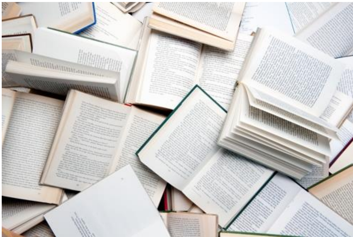
Pagini de cărți,

https://en.wikipedia.org/wiki/File:Urval_av_de_bocker_som_har_yunnit_Nordiska_radets_litteraturpris_under_de_50_ar_som_priset_funnits_(3).jpg