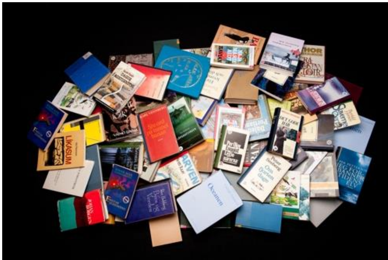
Coperți de cărți,

https://en.wikipedia.org/wiki/File:Urval_av_de_bocker_som_har_yunnit_Nordiska_radets_litteraturpris_under_de_50_ar_som_priset_funnits.jpg